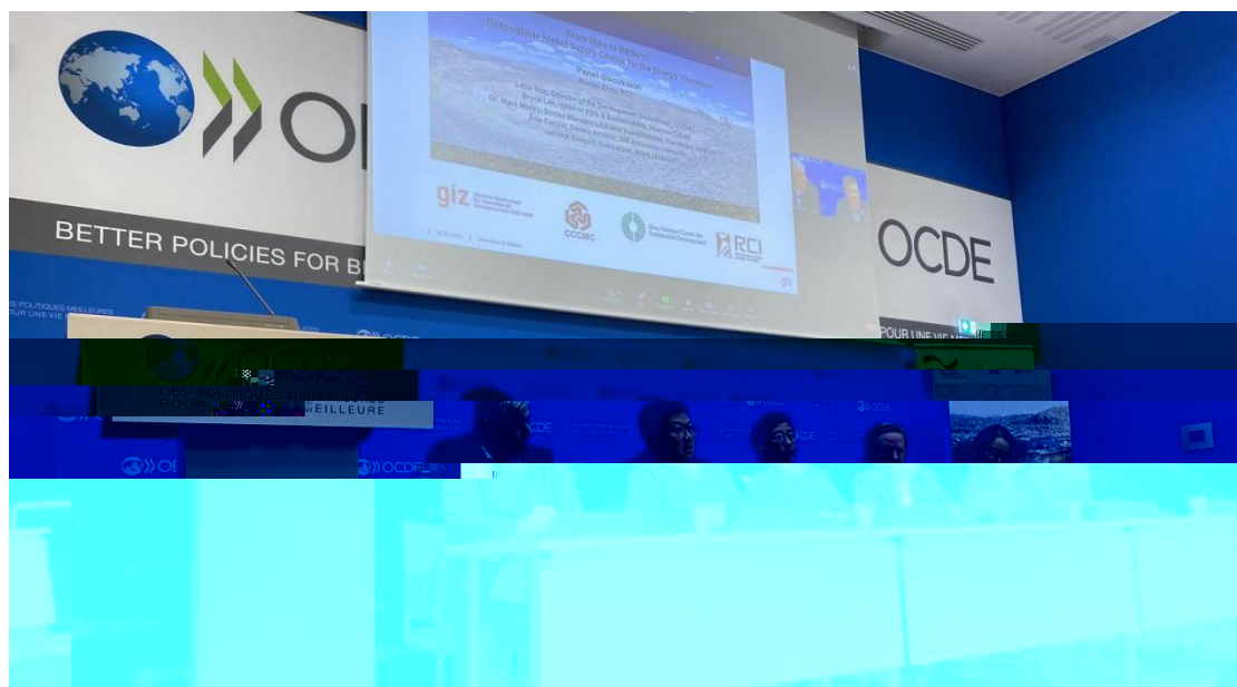
上圖 2023 4